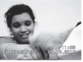
[B] Started Reading